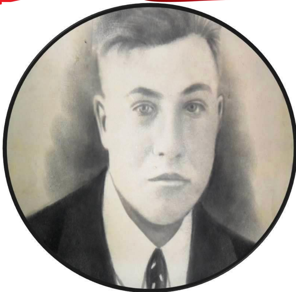
Решетников Пётр Ионнович